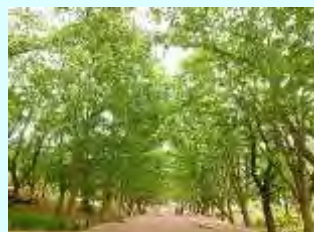
南町田 グランベリー パーク