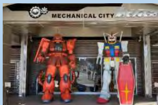
稲城市「MECHANICAL CITY INAGI」