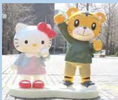
多摩市「ハローキティストリート・しまじろう広場」