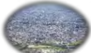
空から見た狛江市