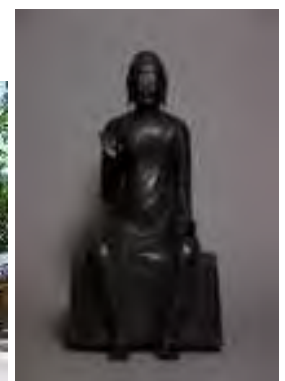
国宝「銅造釈迦如来倚像」