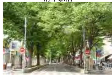
馬場大門けやき並木