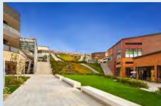
町田市「南町田グランベリーパーク」