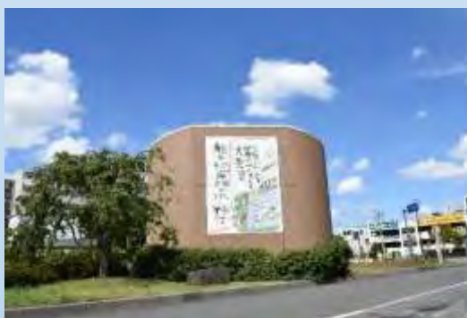
狛江市「巨大絵手紙」