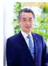
狛江市市長 松原俊雄