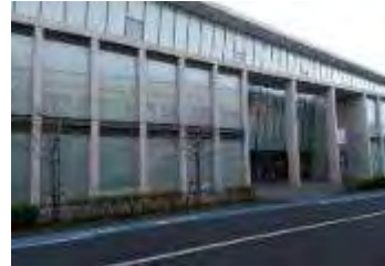
東京アートミュージアム