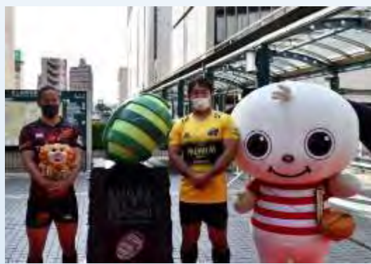
府中市「ラグビーのまち府中」