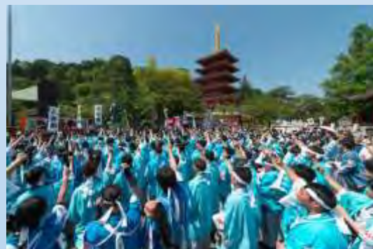
日野市「ひの新選組まつり」