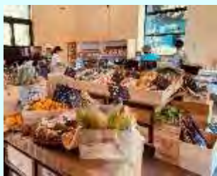
町田 薬師池公園 四季彩の杜