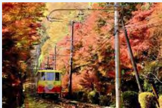
八王子市 日本遺産「霊気満山 高尾山」