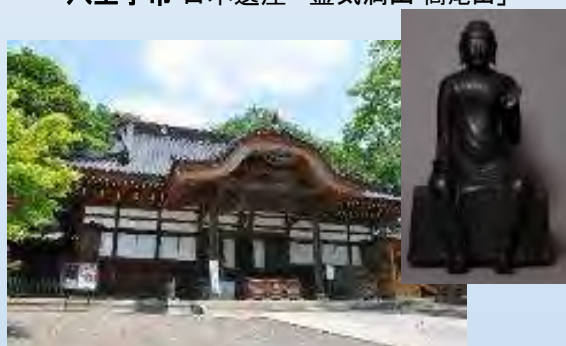
調布市 深大寺 国宝指定「白鳳仏」