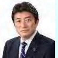
府中市市長 高野律雄