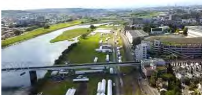
＜総合防災訓練により撮影した様子＞