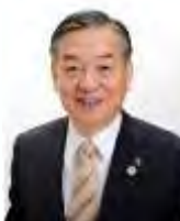
多摩市長 阿部裕行