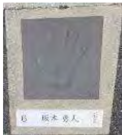
選手の手形( #6 坂本選手)