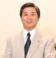
調布市長 長友貴樹