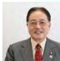
町田市長 石阪文一