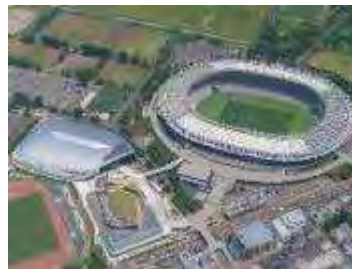
味の素スタジアム

このように西部地域は文化・スポーツの拠点であり、特に2019年のラグビーワールドカップでは大きな賑わいを見せました。また、新選組局長の近藤勇の生家跡があります。