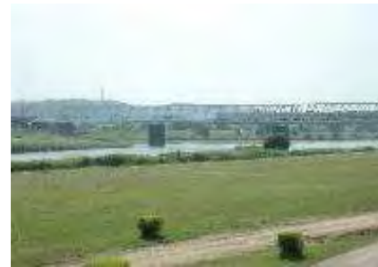
多摩川緑地公園と花火大会

「多摩川」は、水と緑の癒しスポットとして、週末には多くの市民の憩いの場となっているほか、例年夏には市内外から約35万人の来客で賑わう花火大会が開催され、夏の風物詩となっています。