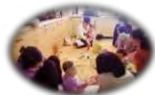
赤ちゃん広場の様子